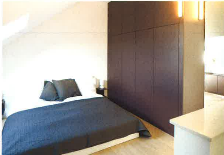
Das große Studio im Dachgeschoss