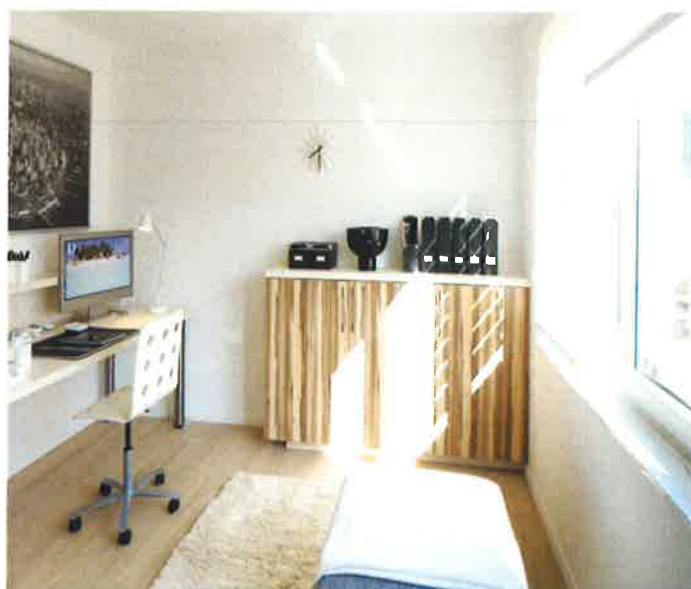
Das Arbeits- oder Kinderzimmer