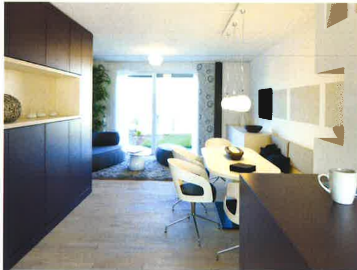
Das geräumige Wohnzimmer