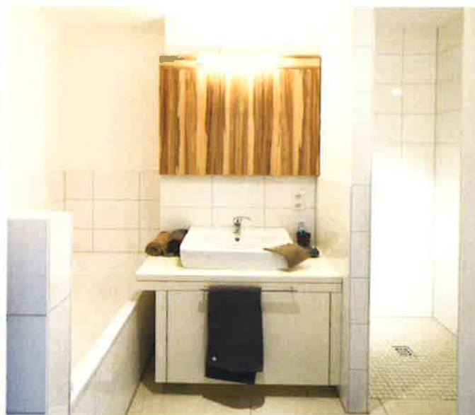
Das Badezimmer mit Badewanne und Dusche

Wohnungsgesellschaft Recklinghausen mbH Am Neumarkt 21 45663 Recklinghausen Telefon: 02361/1807-77 Email: vermietung@wg-re.de www.wg-re.de