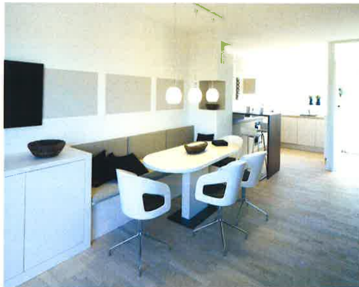
Der offene Koch- und Essbereich